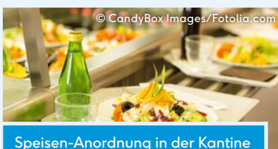
Speisen-Anordnung in der Kantine

Rückmeldung über den eigenen Energie- oder Wasserverbrauch ist ein weiterer wirksamer Nudge, der zu geringerem Verbrauch durch angepasstes Verhalten führt. Personen, die beispielsweise durch eine Verbrauchsanzeige an der Dusche ein Echtzeit-Feedback zu ihrem Warmwasserverbrauch beim Duschen erhielten, verbrauchten elf Prozent weniger Energie. Auch ein visuelles Feedback zum aktuellen Stromverbrauch führt zu einer Reduktion.