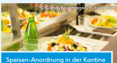
Speisen-Anordnung in der Kantine

Rückmeldung über den eigenen Energie- oder Wasserverbrauch ist ein weiterer wirksamer Nudge, der zu geringerem Verbrauch durch angepasstes Verhalten führt. Personen, die beispielsweise durch eine Verbrauchsanzeige an der Dusche ein Echtzeit-Feedback zu ihrem Warmwasserverbrauch beim Duschen erhielten, verbrauchten elf Prozent weniger Energie. Auch ein visuelles Feedback zum aktuellen Stromverbrauch führt zu einer Reduktion.